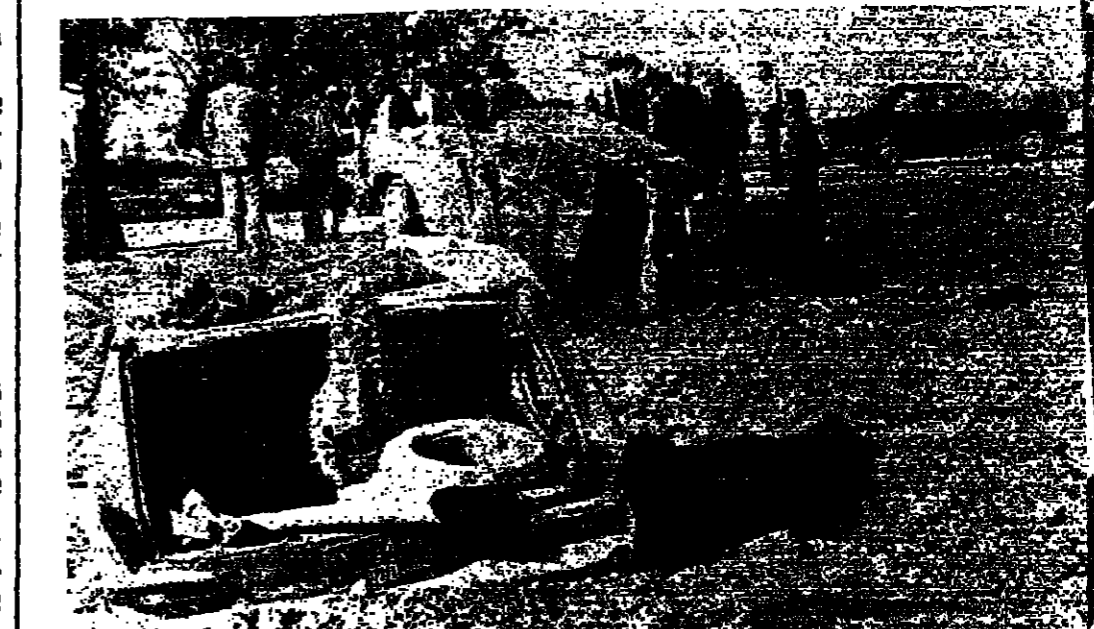
سيارة « المرسيديس » كما يتبدد انشطارها